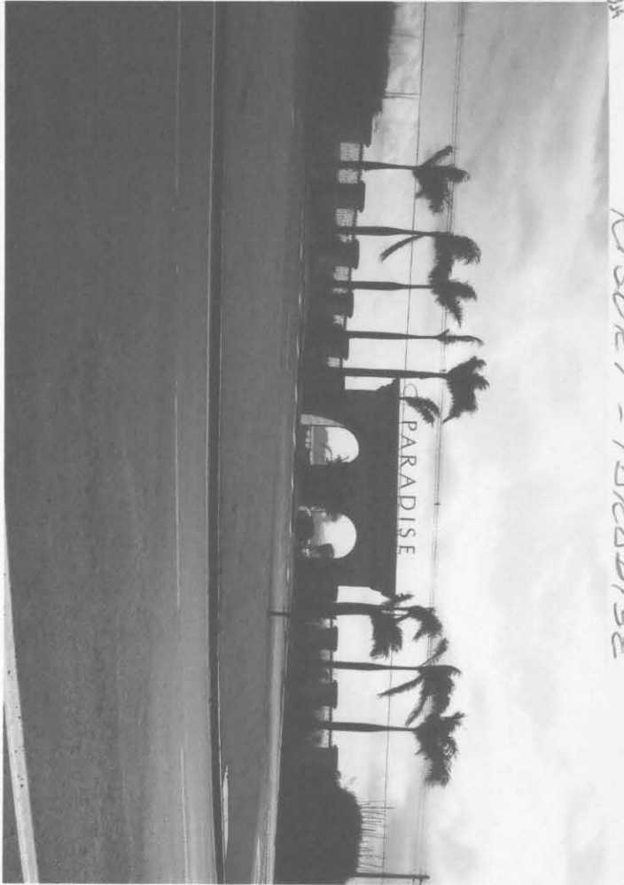
RESORT - PARADISE