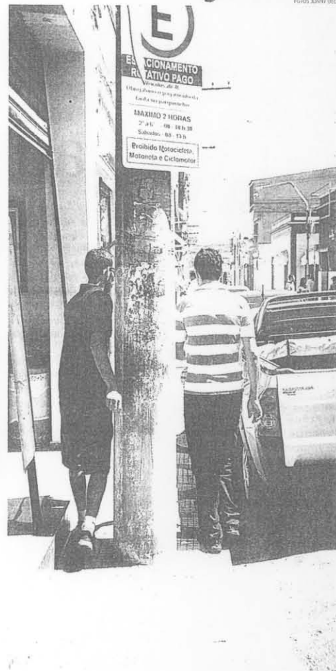
PERIGO Postes instalados no meio da calçada, em ruas como Professor Flaviano de Mello, Padre João e Presidente Rodrigues