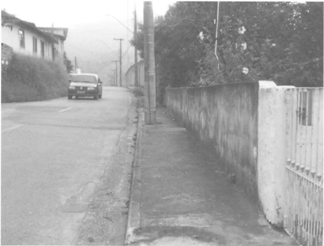
Av. Benedito Pereira de Faria, Jardim Aracy