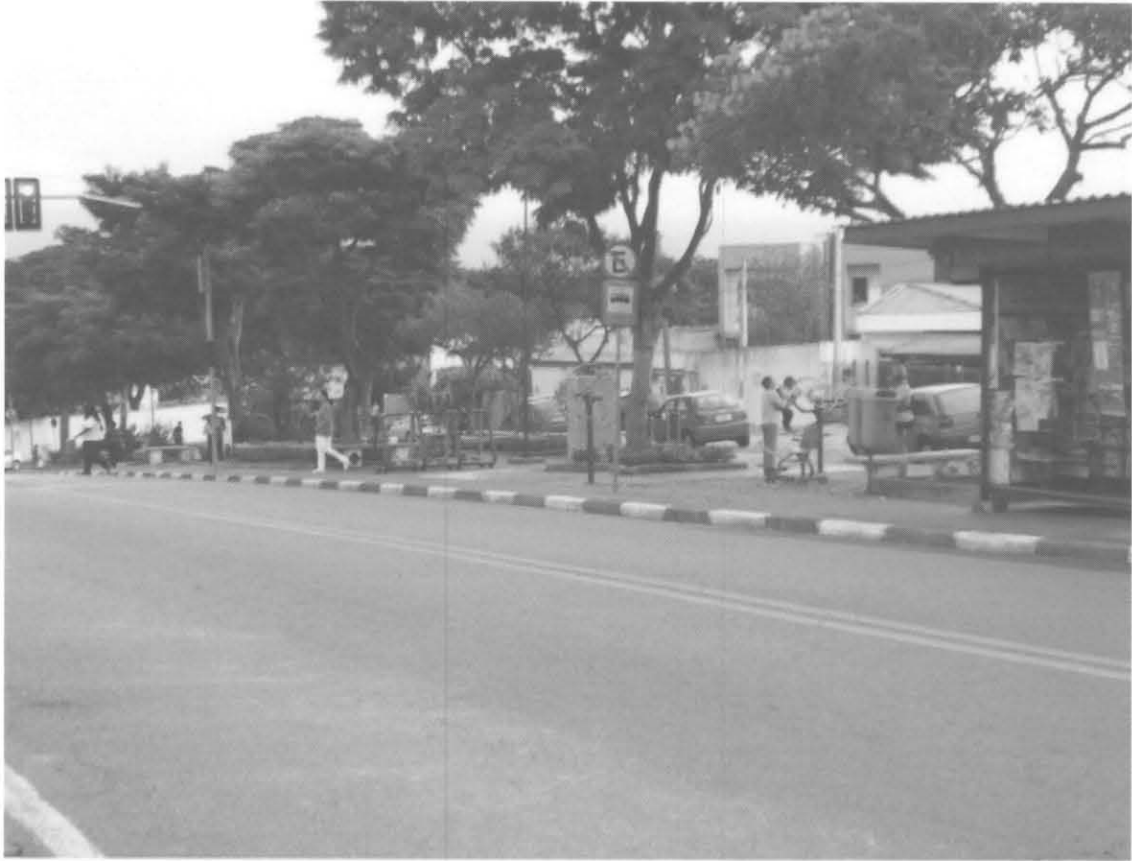
Rua Cardoso de Siqueira, Vila Oliveira