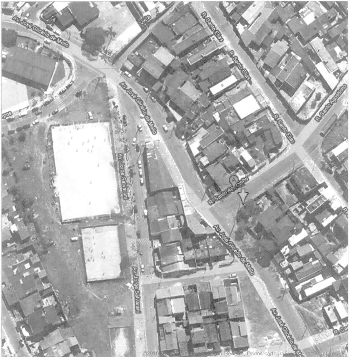
Rua Santo Agostinho, Jardim São ...