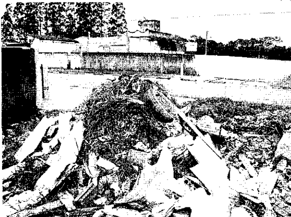
ENTULHO Restos de materiais de construção são deixados em calçadas, no Rodéio, após demolições

“Neste bairro nasci e agora estou sendo abandonado dos moradores”, afirma o proprietário de um imóvel no Jardim Rodéio, de quem a reportagem participou por grande parte das reportagens no bairro. Rodéio, onde são realizadas obras na área em grande parte do Jardim Rodéio, não é o único bairro que sofre com a falta de manutenção e abandono de áreas. O bairro de São Paulo (SP) também tem problemas de abandono de áreas e falta de manutenção. A falta de manutenção e abandono de áreas é um problema comum em bairros de classe média e baixa em São Paulo.