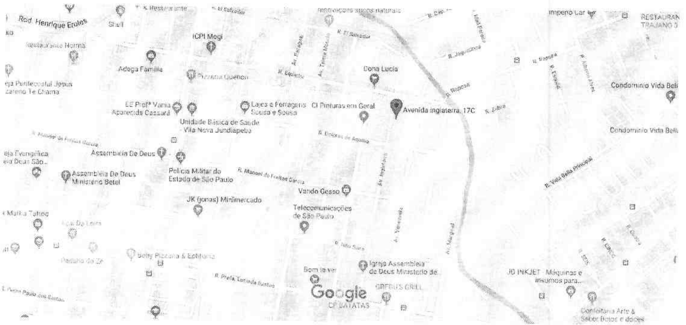
Dados do mapa ©2019 100 m