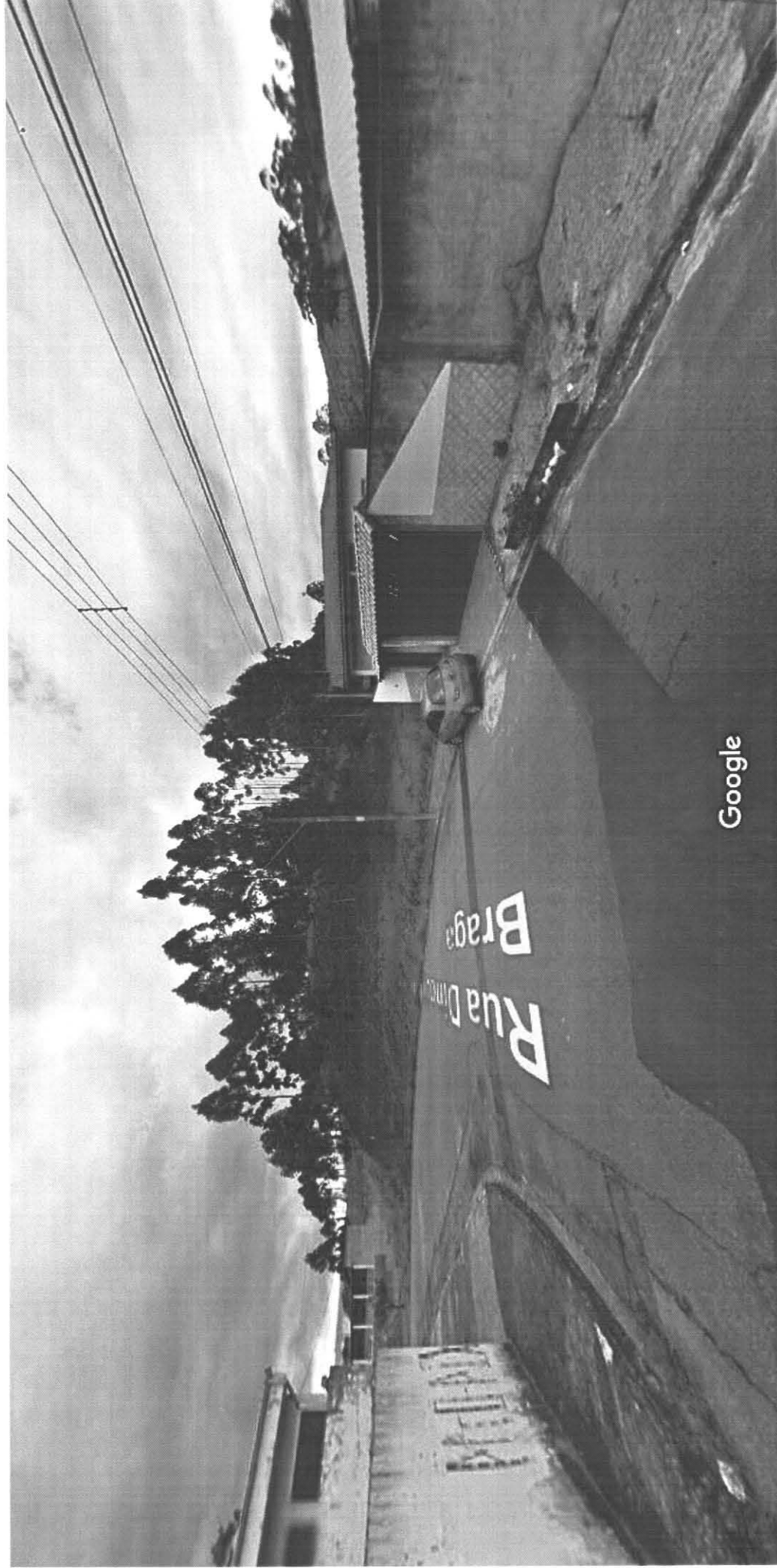
Captura de imagem: mai 2011

Google Maps 272 Rua Dinorah da Conceição Braga MORADA DO SOL, MOGI DAS CRUZES - SP