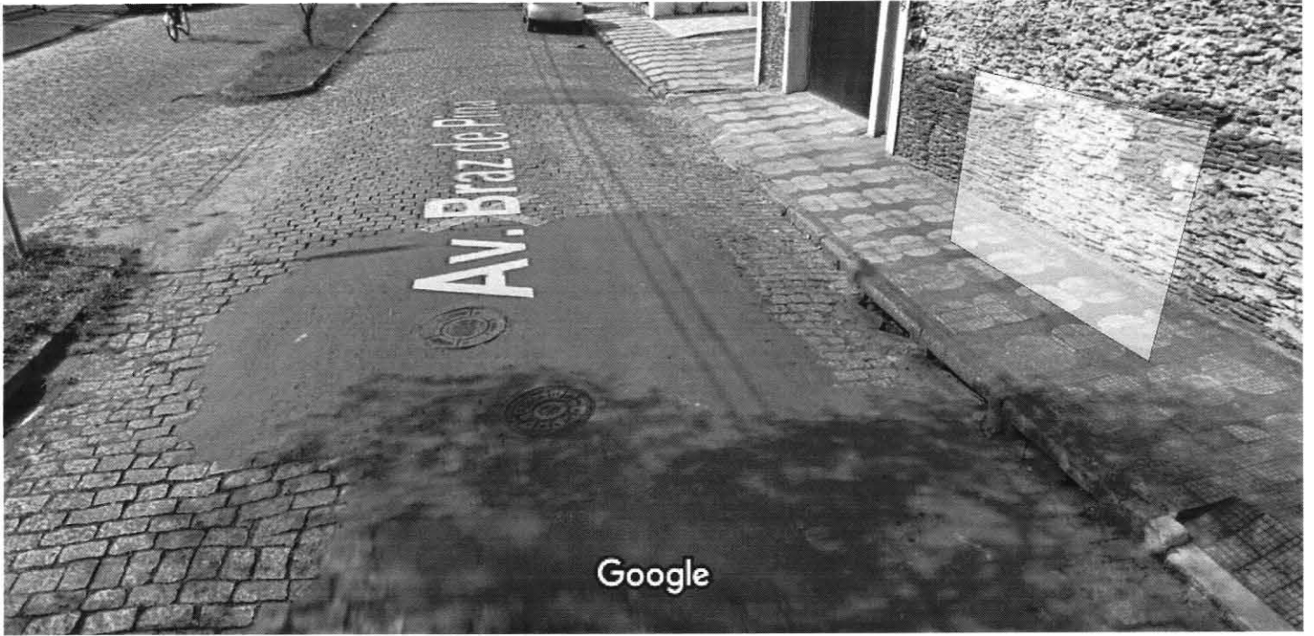
Captura da imagem: jul 2015