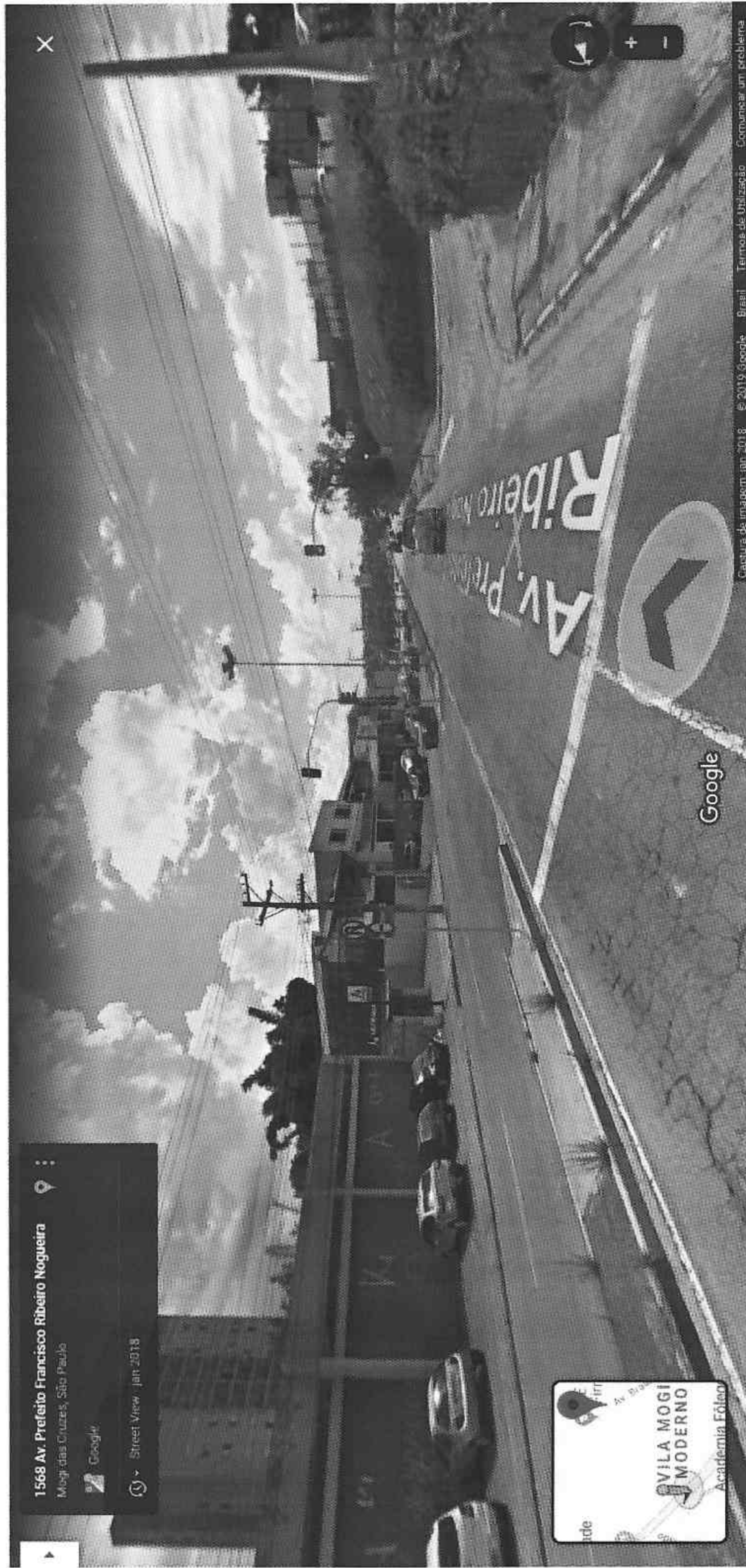
Exemplo da abertura de acesso da Rua José Antonio Rosa com a Prefeito Ribeiro Nogueira – Mogi Moderno