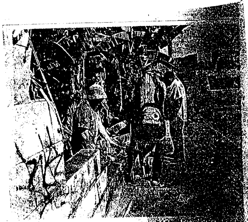
OBRAS Passagem no muro de terreno do DAEE está sendo feita