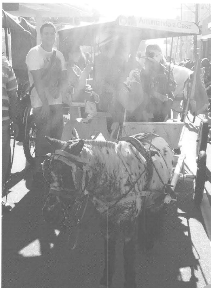
Uso de Espora