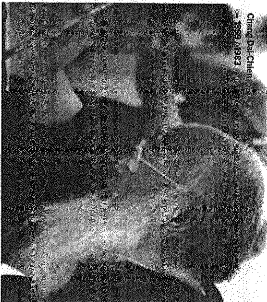
MÓGI DE A A Z