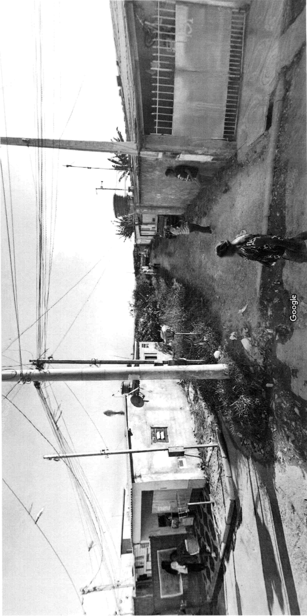
Captura da imagem: jul. 2018