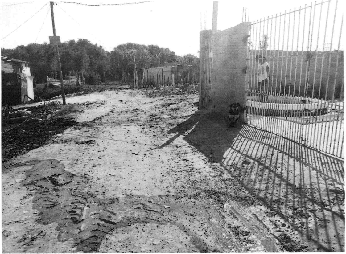
Travessa da Rua Constelation - Jardim Aeroporto III