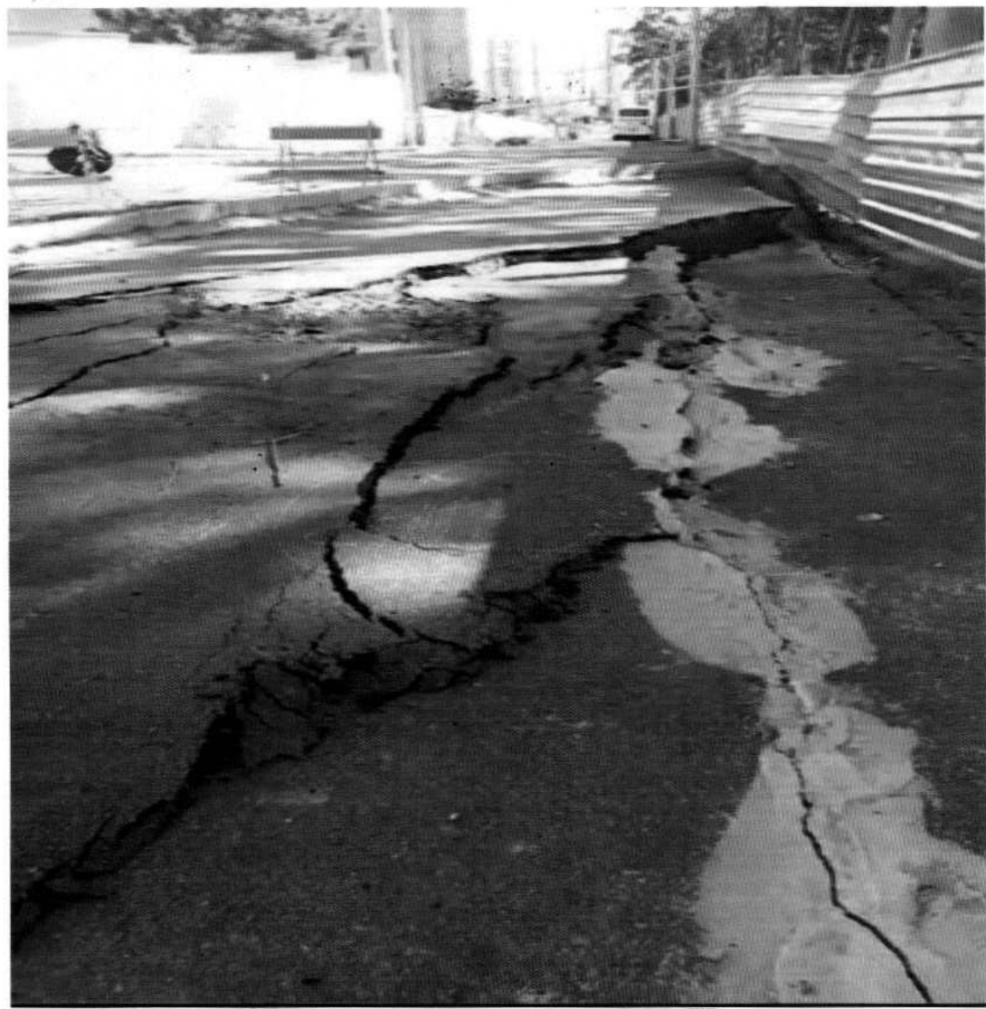
Av. Kenned. —