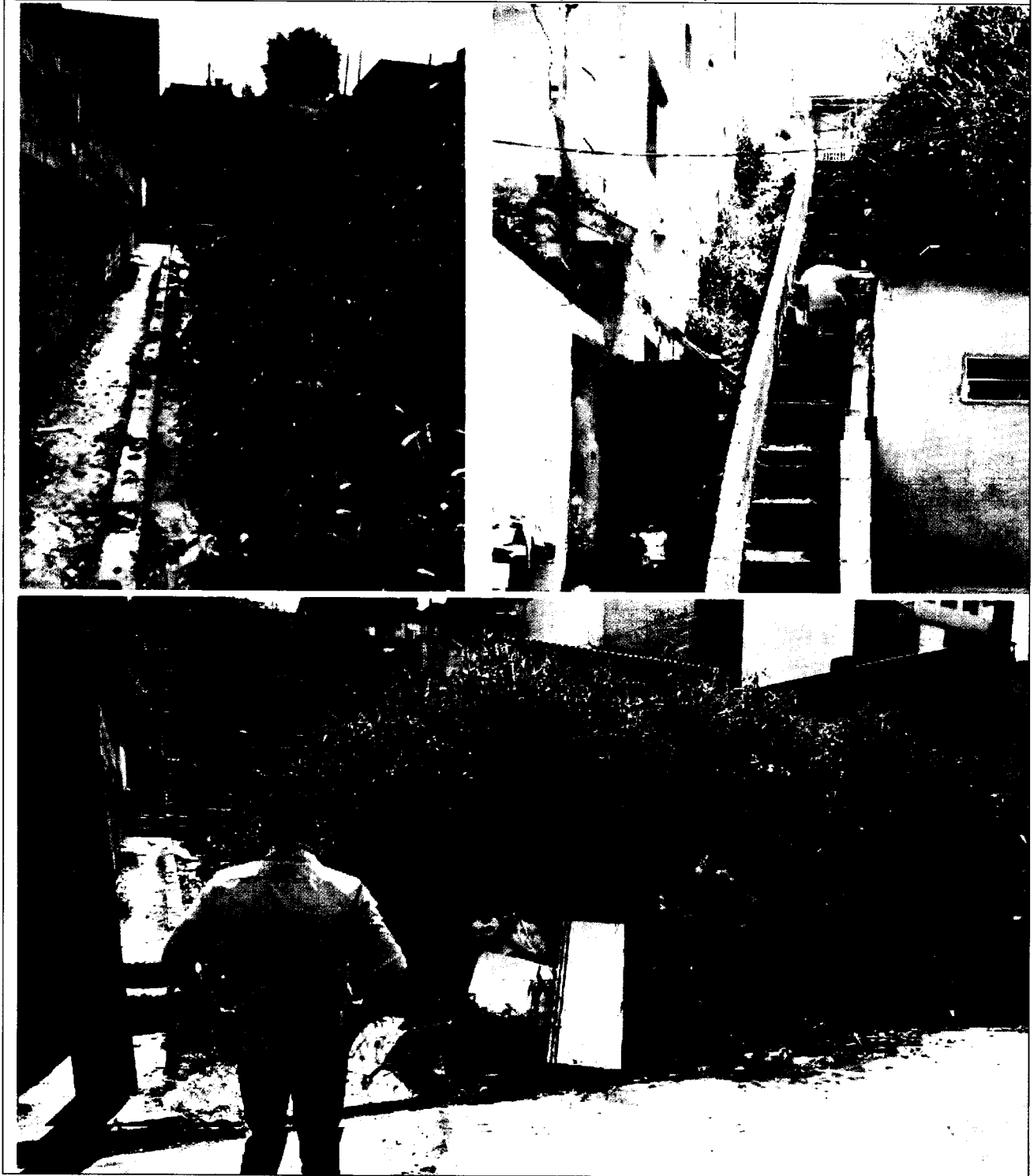
Rua Congonhas / Rua Lindenberg – Jardim Aeroporto III