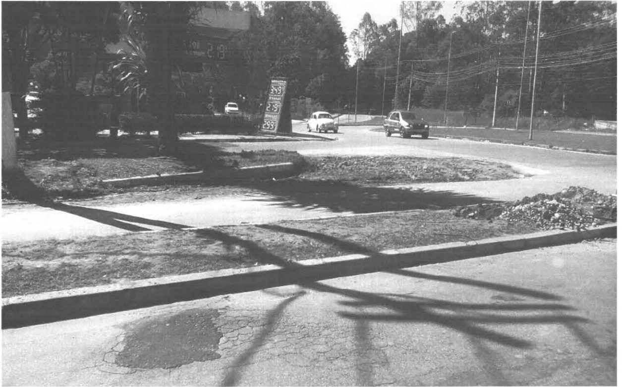
Local Indicado para retirada de canteiro .