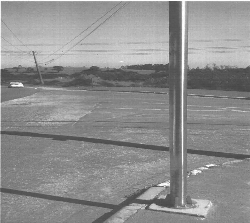
Local indicado para a construção da rotatória .